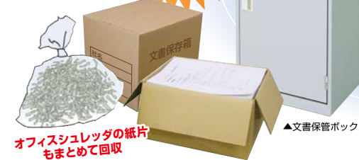
オフィスシュレッダの紙片 もまとめて回収